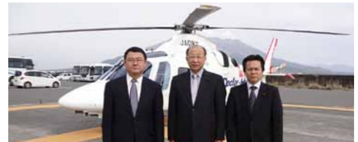
▲H23.12.26 ドクターヘリがスタート