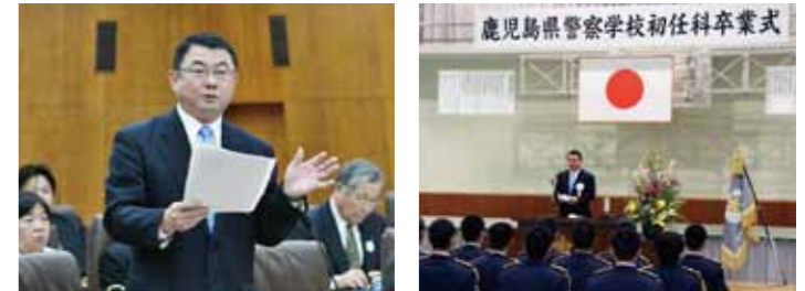
▲3.7 予算特別委員会の質問