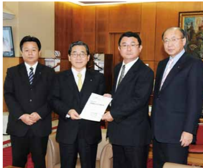
▲「平成24年度予算編成に対する要望書」提出