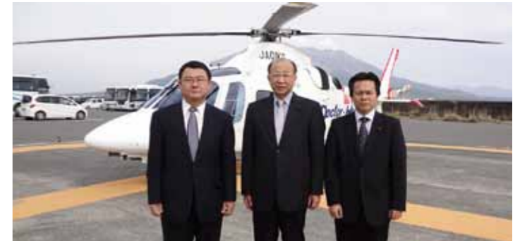
▲H23.12.26 ドクターヘリがスタート