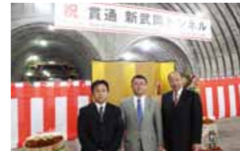
▲新武岡トンネル貫通式