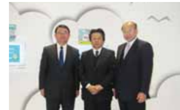
▲神奈川メガソーラー視察