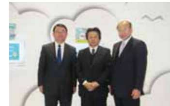
▲神奈川メガソーラー視察