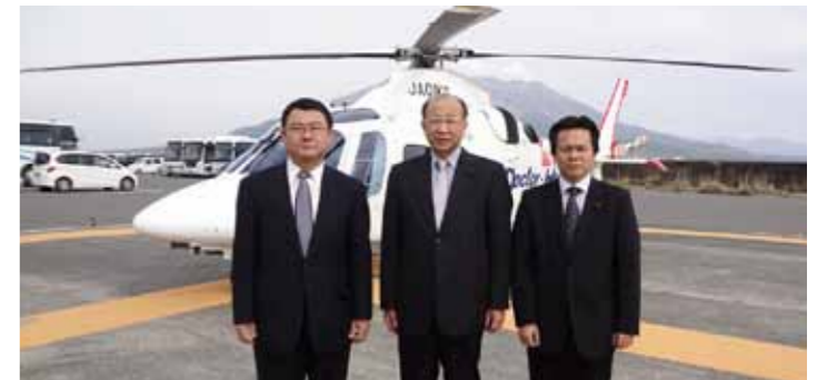
▲H23.12.26 ドクターヘリがスタート