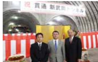
▲新武岡トンネル貫通式