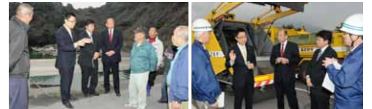
▲秋野参議院議員と桜島視察、その後、参院災害特別委員会で質問