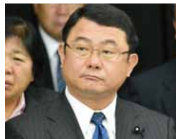
11/27 あなたのそば県議会(鹿屋)