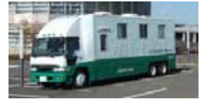
移動式全身カウンター車