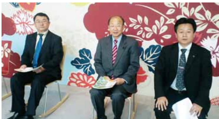
11/24 年間150万人訪れる「金沢21世紀美術館」