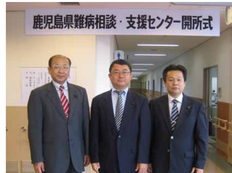
▲「難病相談・支援センター」がハートピア3階にオープン・開所式に出席しました。県内15の患者団体でつくる「かごしま難病支援ネットワーク」の事務局も設置されました。 ※相談受け付けは午前9時~午後4時(火曜、祝日、年末年始定休) 電話099(218)3133。