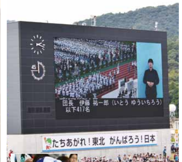
▲山口国体を視察。第75回国民体育大会の本県開催が内々定(平成32年)