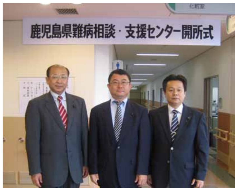
▲「難病相談・支援センター」がハートピア3階にオープン・開所式に出席しました。県内15の患者団体でつくる「かごしま難病支援ネットワーク」の事務局も設置されました。

※相談受け付けは午前9時～午後4時(火曜、祝日、年末年始定休) 電話099(218)3133。