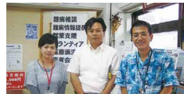
沖縄の支援センターを訪問。地元公明党県議が設立に尽力したと聞いて感動!