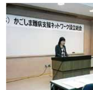
2月11日 かごしま難病支援ネットワーク設立総会に出席

難病団体の方々と何回も懇談を重ねる中で、患者家族が気軽に来られる相談・支援センターが必要とのご要望から、私自身、沖縄の相談支援センターを訪問したり、他県の状況を調査して県当局に要望を続けていきました。