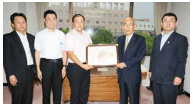
▲平成22年6月18日 口蹄疫募金の感謝状授与式に同席